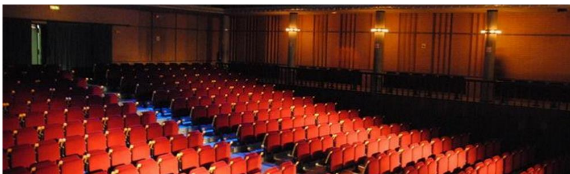
Fotografía de la sala del Teatre Auditori Municipal Narcís Masferrer.