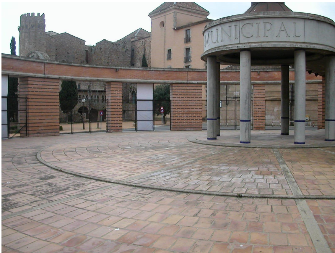
Fotografía de la fachada del Teatre Auditori Municipal Narcís Masferrer.