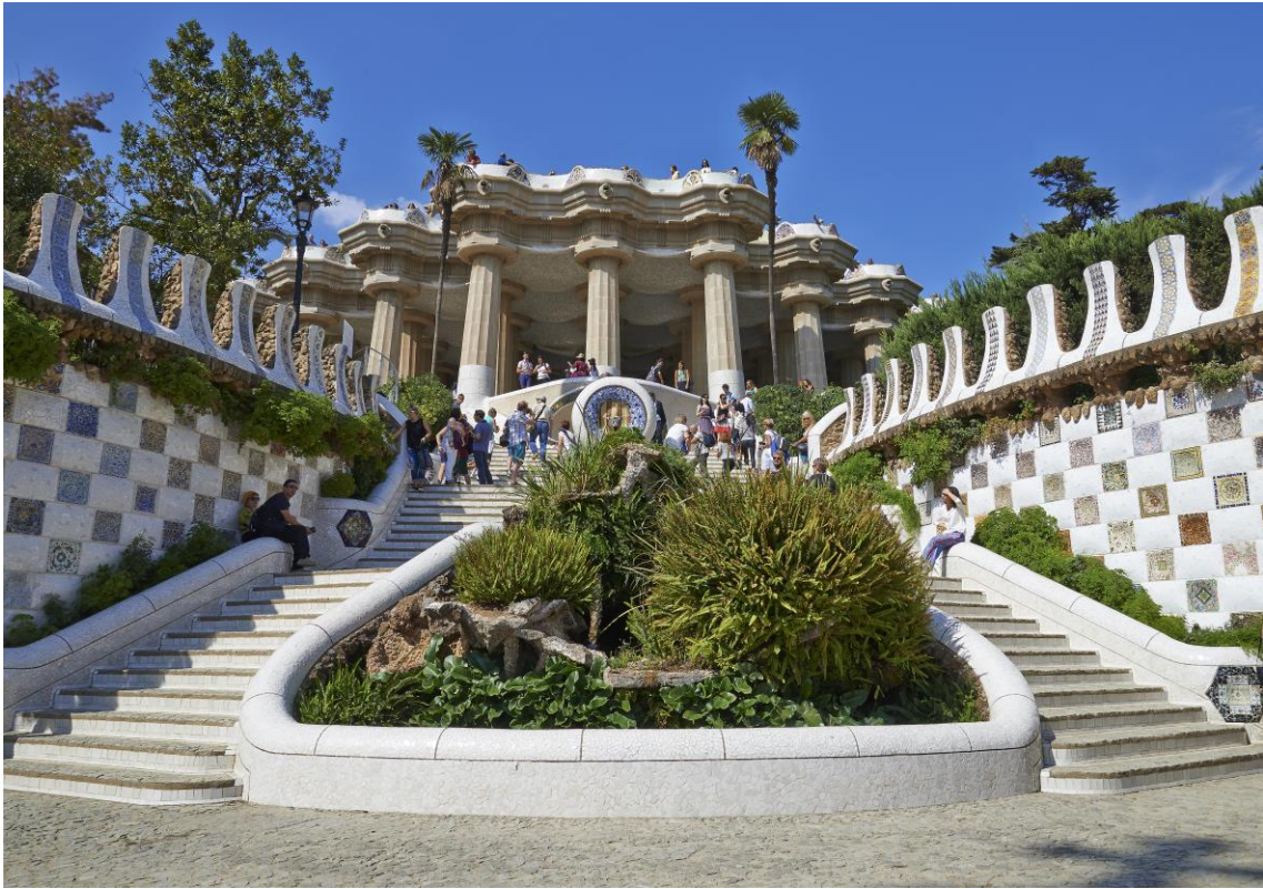
Fotografia de l'entrada del Park Güell