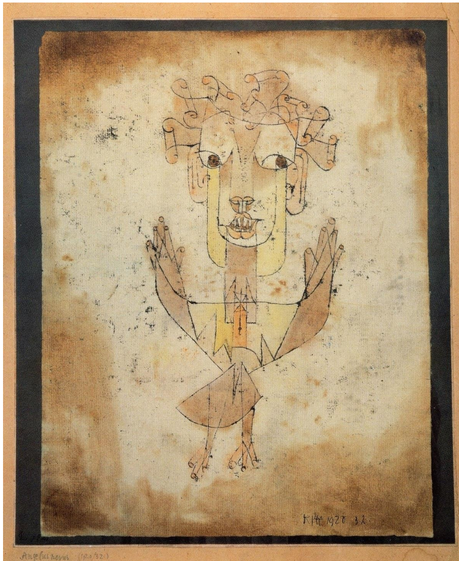
Angelus Novus de Paul Klee, 1920

Cada participant va fer una presentació oral sobre la seva experiència en l'àmbit educatiu i artístic. Es van presentar els materials amb els quals anàvem a treballar (fulles blanques, paper carbó, burins de punta rodona i cinta adhesiva de carrosser). També es van exposar algunes referències com a antecedents dels dibuixos cecs.