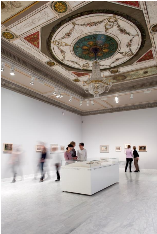
Fotografía de una sala del Museu Picasso.