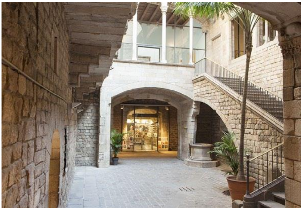
Fotografía de la entrada del Museu Picasso.