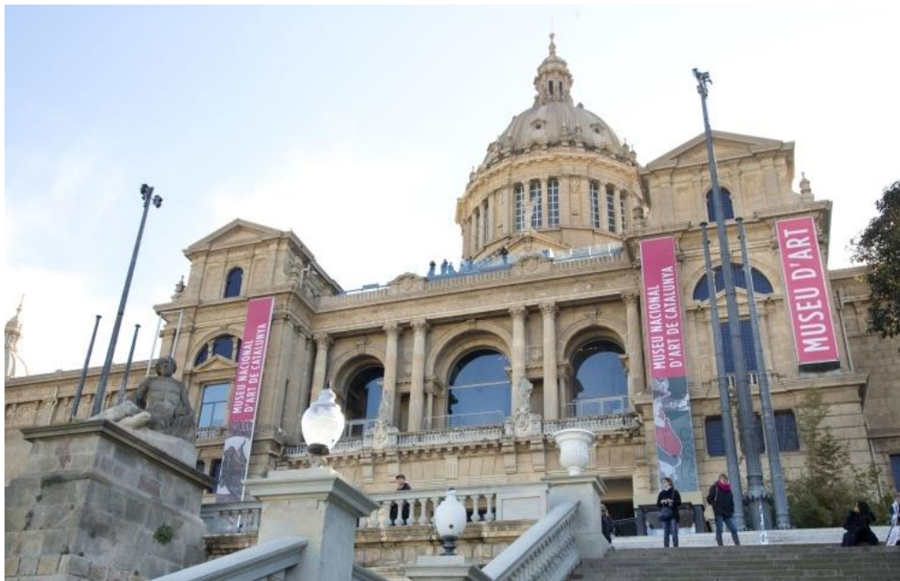
Fotografia de la façana del Museu Nacional d'Art de Catalunya