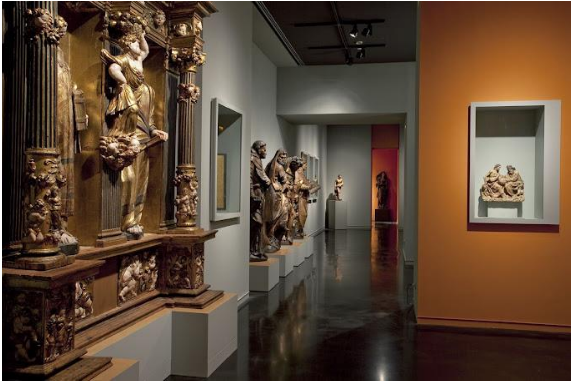
Fotografia d'una de les sales del Museu Marès