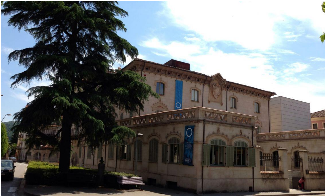
Fotografia de la entrada del Museu dels Sants.