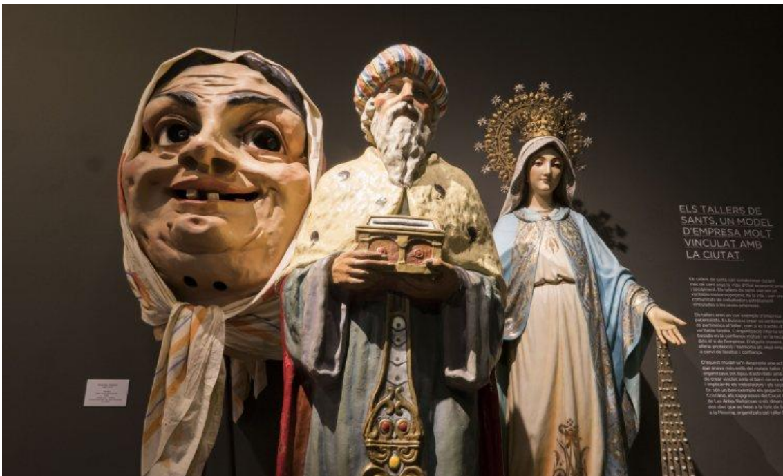
Fotografia de una de las salas del Museu dels Sants.