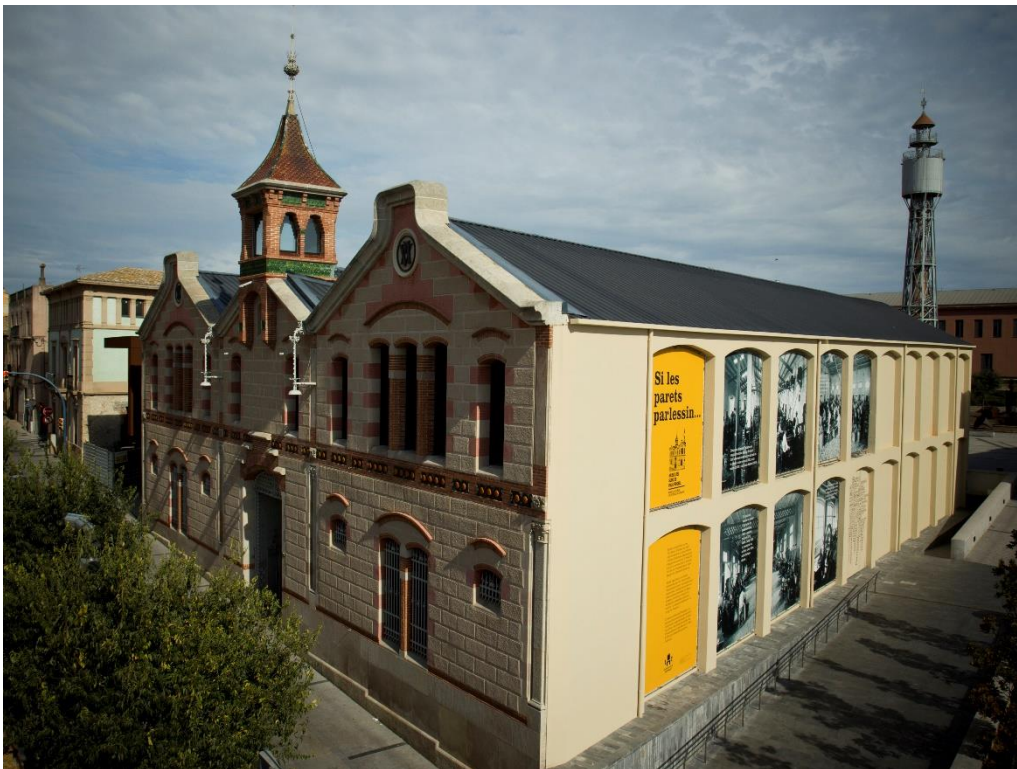
Fotografía de la fachada del Museu del Suro de Palafrugell.