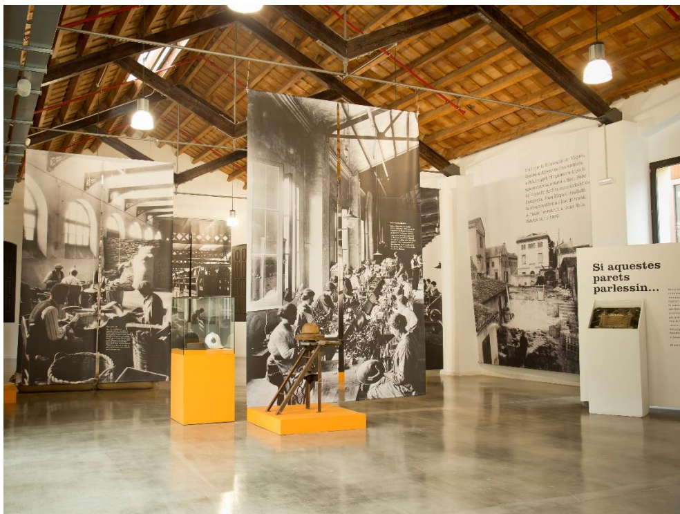
Fotografía de una de las salas del Museu del Suro de Palafrugell.