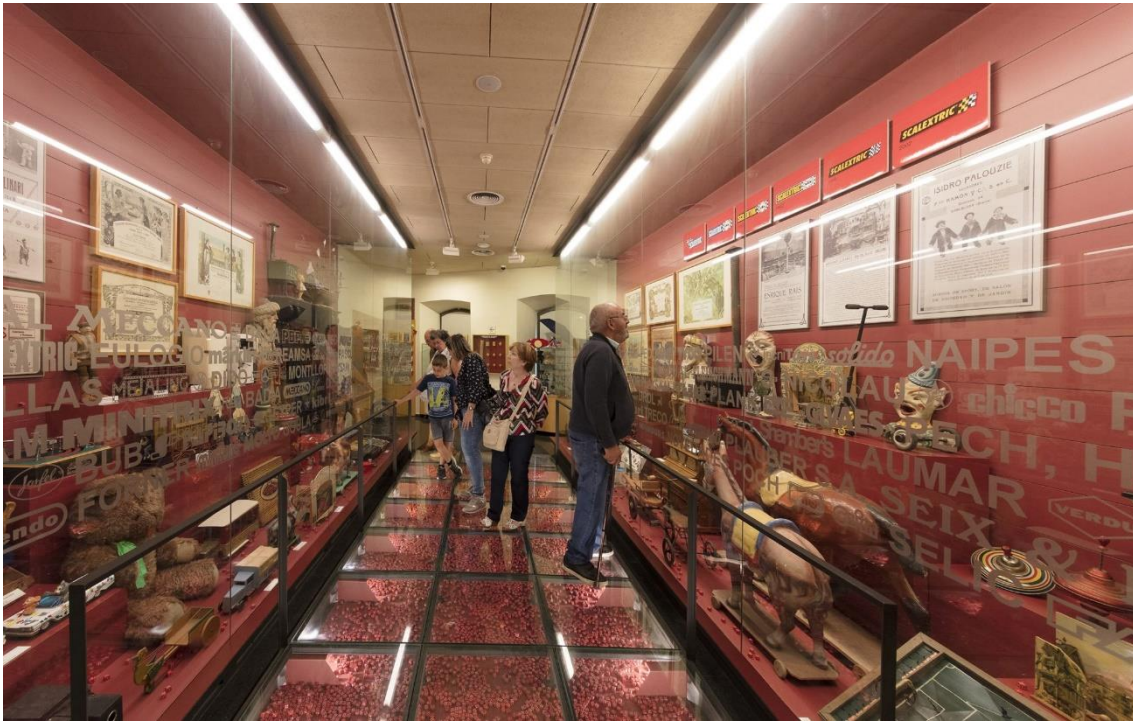
Fotografia d'una de les sales del Museu del Joguet.