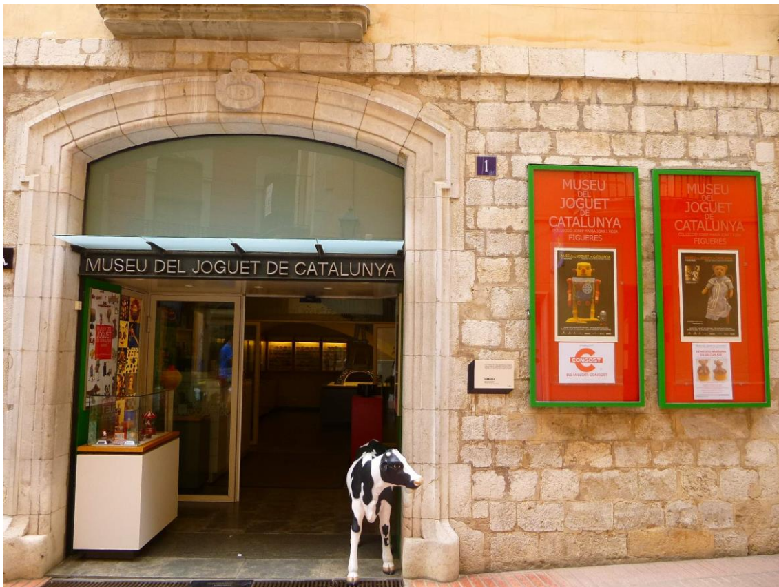
Fotografia de la façana del Museu del Joguet.