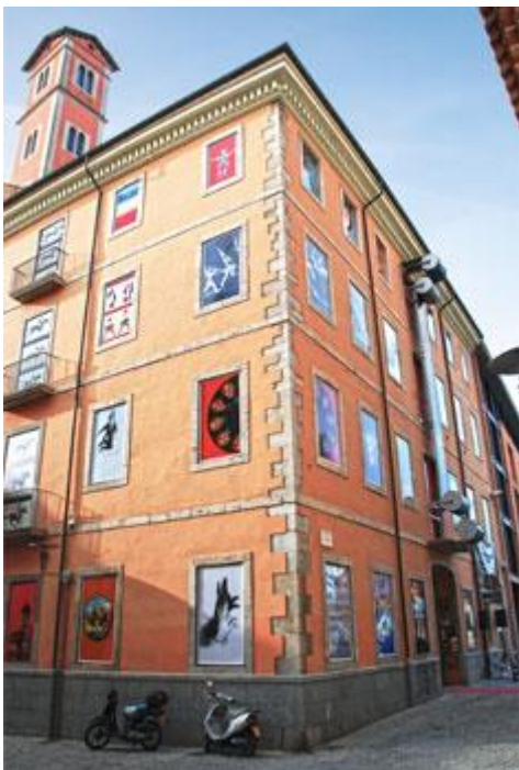
Fotografia de la façana del Museu del Cinema.