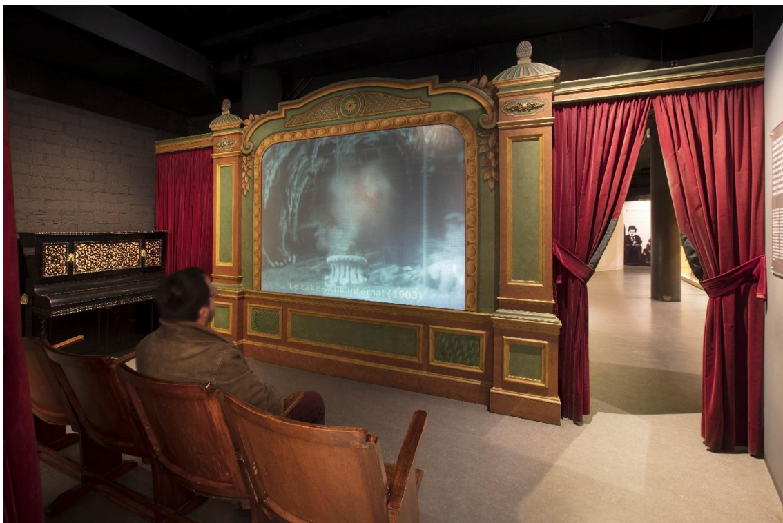
Fotografia d'una de les sales del Museu del Cinema.