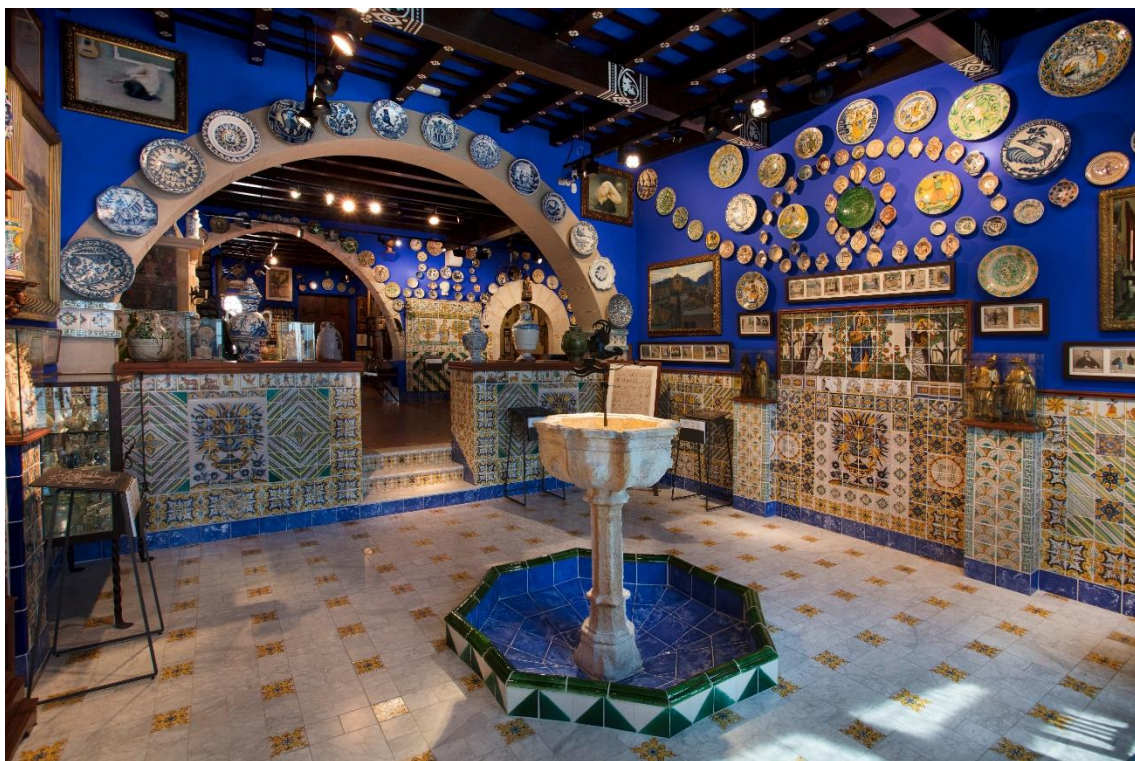
Fotografía de una de las salas del Museu del Cau Ferrat.