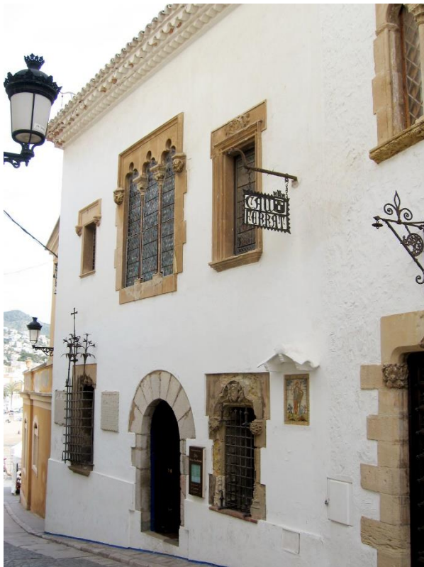
Fotografía de la fachada del Museu del Cau Ferrat.