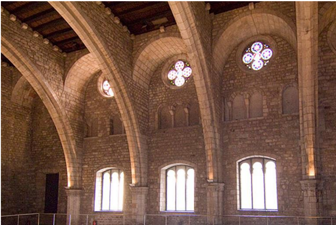
Fotografía de una de las salas del Museu d'Història de Barcelona.