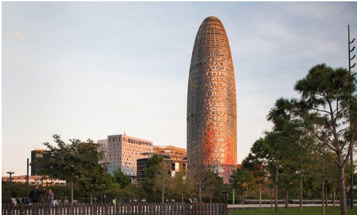
Fotografia de l'exterior del Mirador torre Glòries