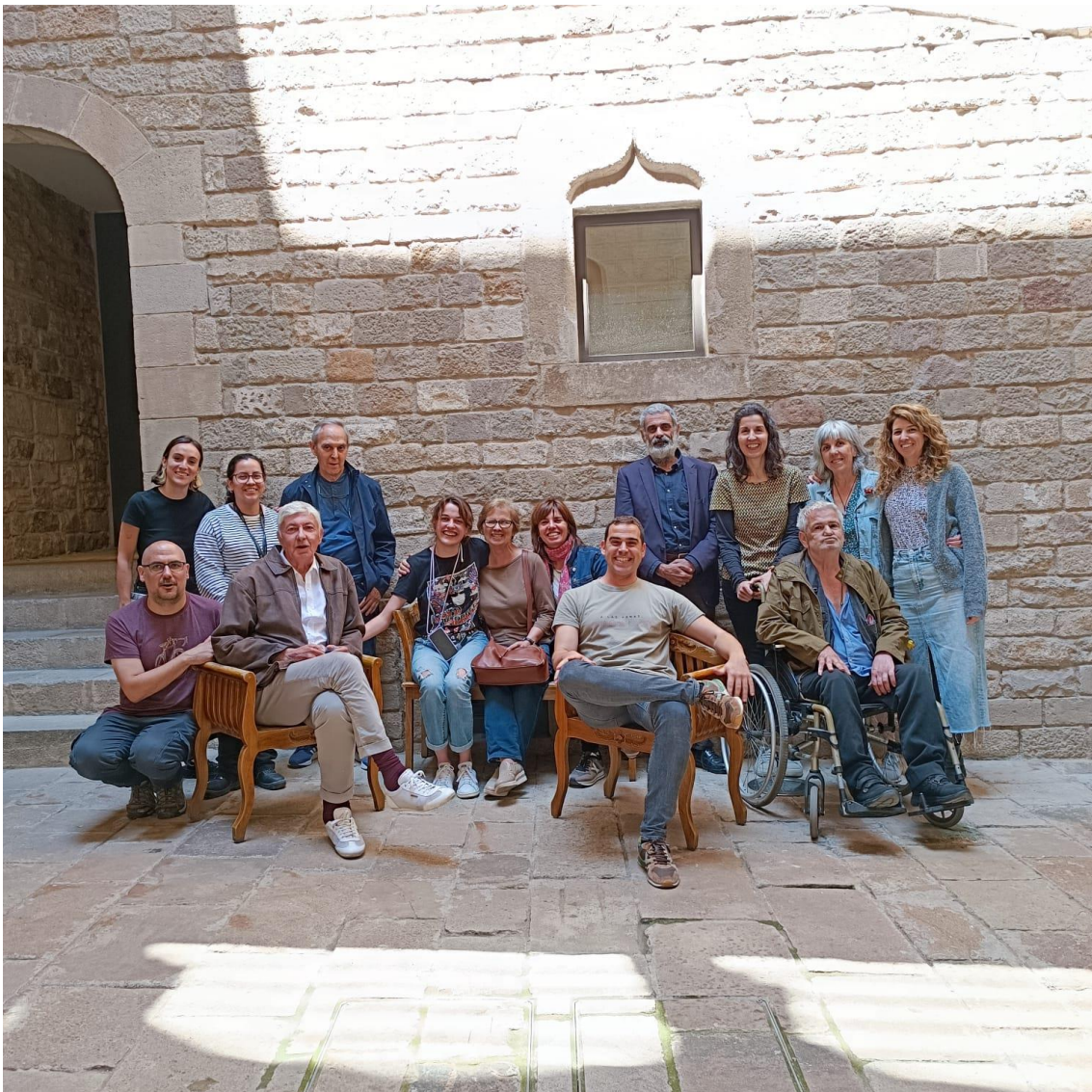
Participants i organitzadores del Grup de Discussió Sensellarisme i Cultura en la seva darrera sessió al Museu Etnològic i de les Cultures del Món

En resum, aquest treball planteja una sèrie d'idees i propostes que busquen superar les barreres físiques i simbòliques així com reconceptualitzar el significat de les noves lluites polítiques del moviment social i ciutadà (Tirado, 2009) als equipaments culturals i garantir un accés inclusiu, acollidor i transformador per a les persones en situació de sense llar.