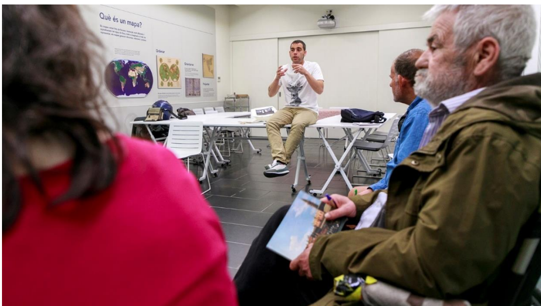
Primera sessió del grup de discussió.

Han participat en aquest procés 16 persones entre participants i professionals, d'entitats com Càritas, Assís i Arrels.