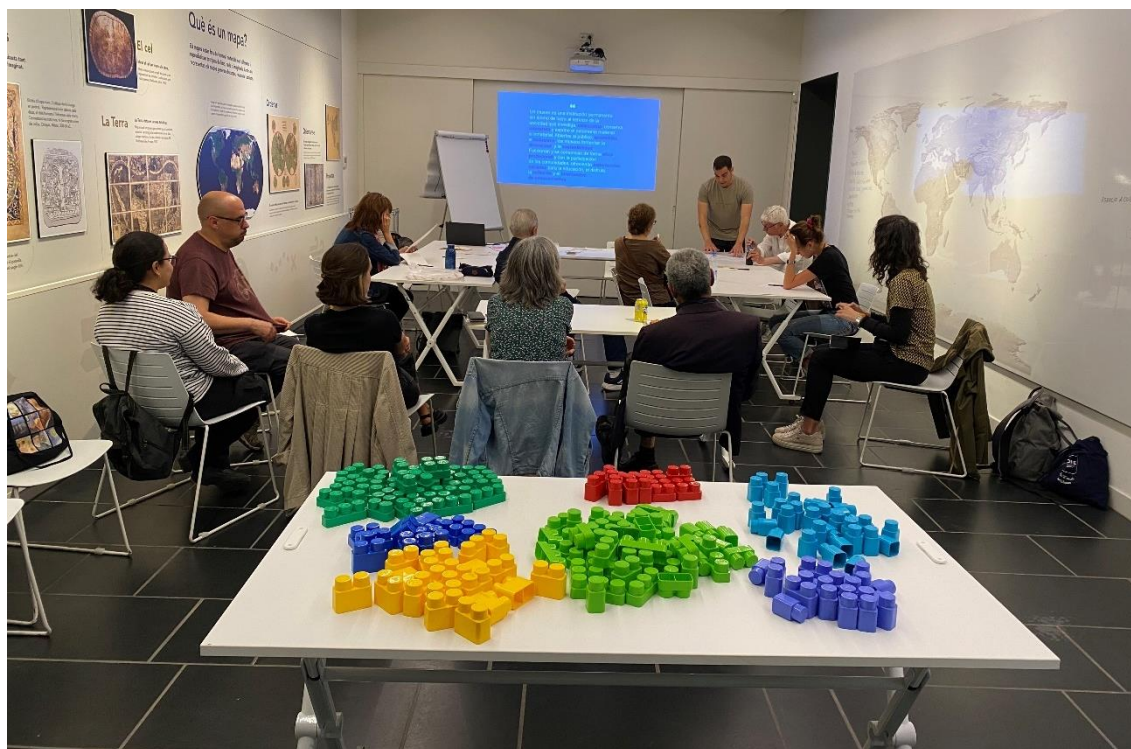
A la tercera sessió vàrem construir el nostre equipament cultural ideal