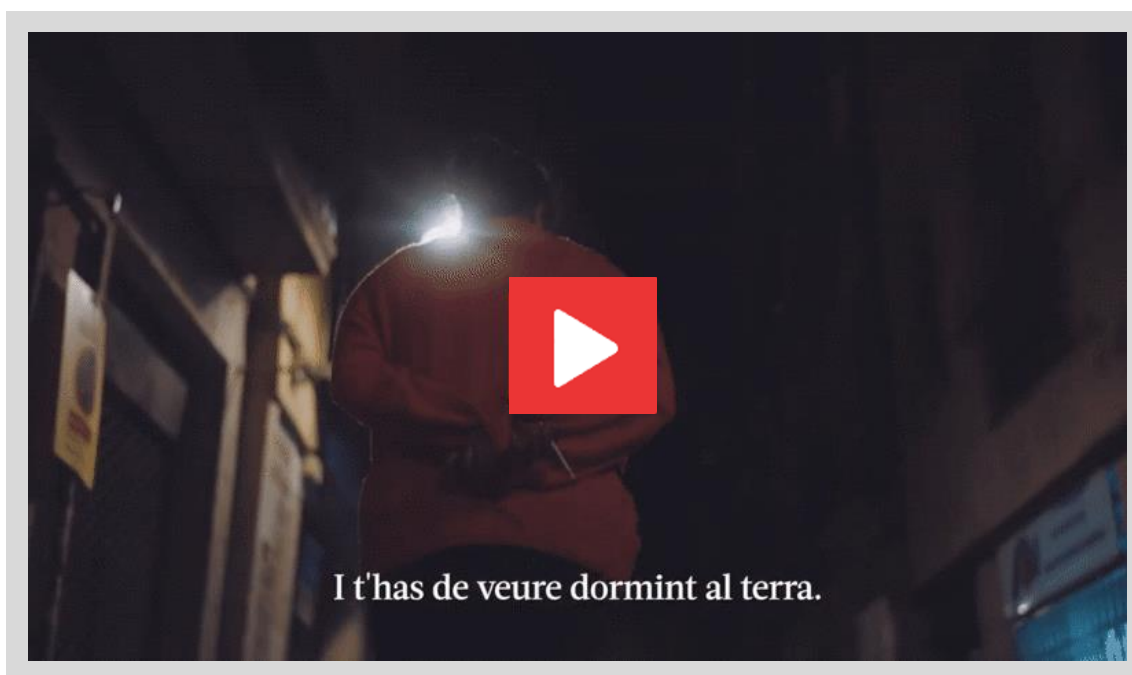
Vídeo de la campanya La llar de totes d'Apropa Cultura

En els primers mesos d'aquest període, es va identificar la necessitat de combatre els estigmes i prejudicis que envolten el Sensellarisme. Com a resposta a aquesta necessitat, es van realitzar formacions a Barcelona, Lleida, Tarragona i Girona dirigides als professionals dels equipaments culturals. Al mateix temps, es va posar en marxa una campanya de comunicació de sensibilització i es van organitzar trobades per generar coneixement col·lectiu, com les Jornades d'Accessibilitat i Diversitat (Sensellarisme i Cultura) que es van celebrar al MACBA al febrer de 2023, així com projeccions de pel·lícules i curtmetratges al CCCB i al Palau de la Música.