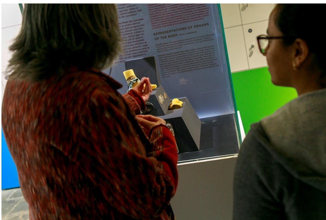
Participants del grup de discussió gaudint del Museu Etnològic i de les Cultures del Món

Una de les propostes específiques que apareix en aquest grup és clara: Que els equipaments participin a les taules comunitàries i d'entorn