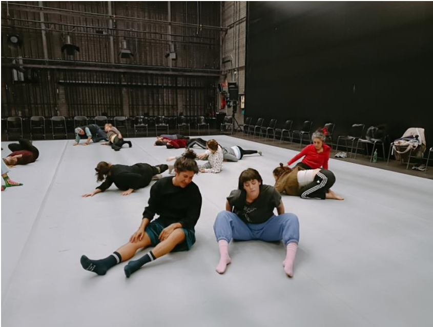
Exercici de ser motllo de l'altre.

quiet, B marxa cuidadosament sense moure a A. Observa a A i troba un altre lloc de relació de contacte amb A. Quan B es queda quiet, A es mou sense moure a B, ..... i així successivament. Primer fem el joc per parelles. Posteriorment, es proposa anar reunint-se parelles amb altres parelles, creant grups més grans de joc.