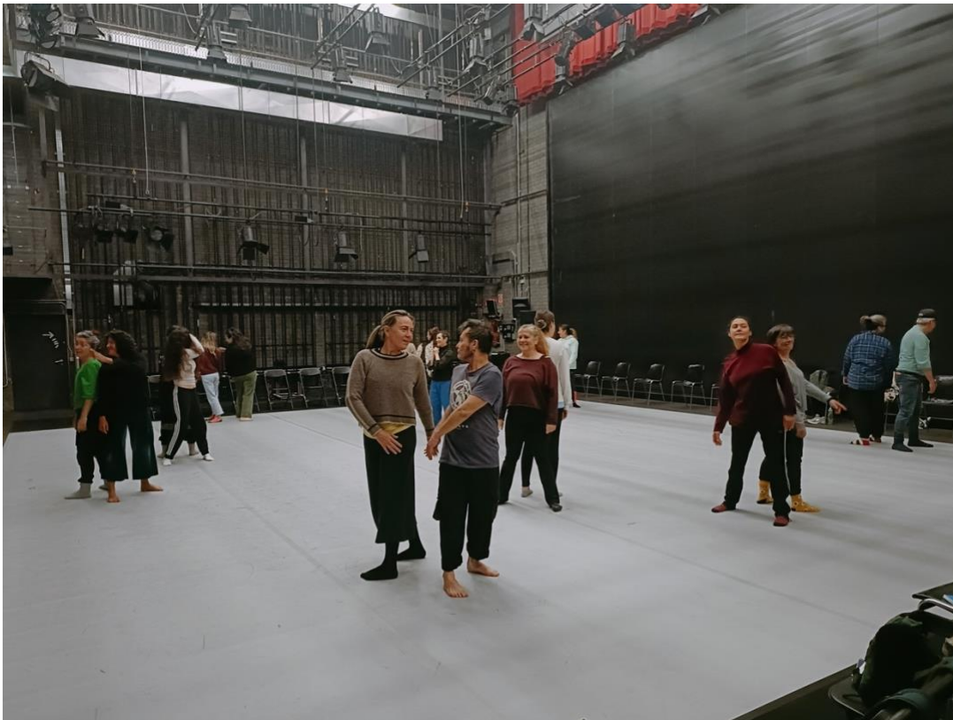
Treball d'escolta per parelles.

Desplaçaments per terra. Entreguem el nostre pes a la terra i ens desplaçem i modifiquem la nostra arquitectura, lliscant parts del nostre cos. Després ens desplaçem per terra imaginant que ens "dipositem" sobre la terra. Imaginem de nou que el terra és argilla i anem deixant empremtes: escolpint-lo amb les parts del nostre cos que toquen a terra.