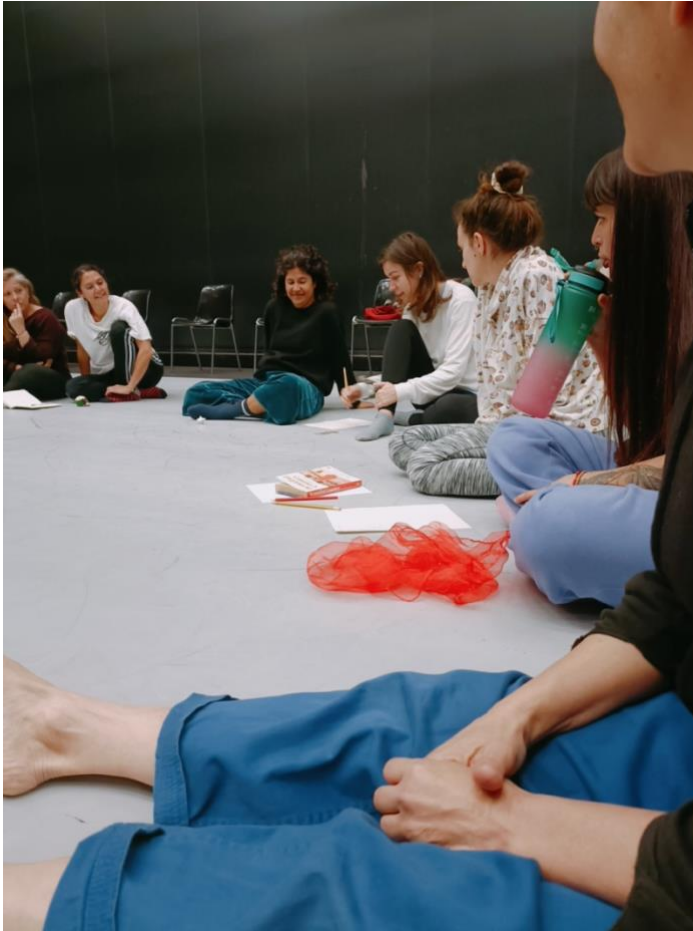
Posada en comú de l'exercici d'intuïció.

Per parelles. Una treballa amb ulls tancats. La companya amb ulls oberts, ofereix un estimul tàctil al cos de la persona d'ulls tancats. Com una "dutxa" amb una textura de toc. Un cop rebut aquest input tàctil, la persona d'ulls tancats, deixa que aquest paisatge "imprès" al seu cos s'expressi, es converteixi en un paisatge de moviment. Deixant que aquesta textura de moviment creixi, es faci molt petita, visqui a tot el cos, sigui ballada per només una part del cos, .... Després d'una estona d'estudi i descobriment d'aquest paisatge de moviment, arribem a un lloc de pausa, de quietut. Deixem que arribi una paraula, com un "titular" per a aquesta textura de moviment. Fem aquest procés, tres cops. Rebem tres estímuls tàctils diferents, descobrim i practiquem tres textures de moviment, cadascuna amb una paraula-títol diferent. Un cop tenim tres textures de moviment diferents, fem una improvisació viatjant per aquests tres paisatges trobats. Les persones que han acompanyat donant els estímuls tàctils, acompanyen desde la mirada. Posteriorment acompanyen des del contacte d'una mà a l'espatlla.