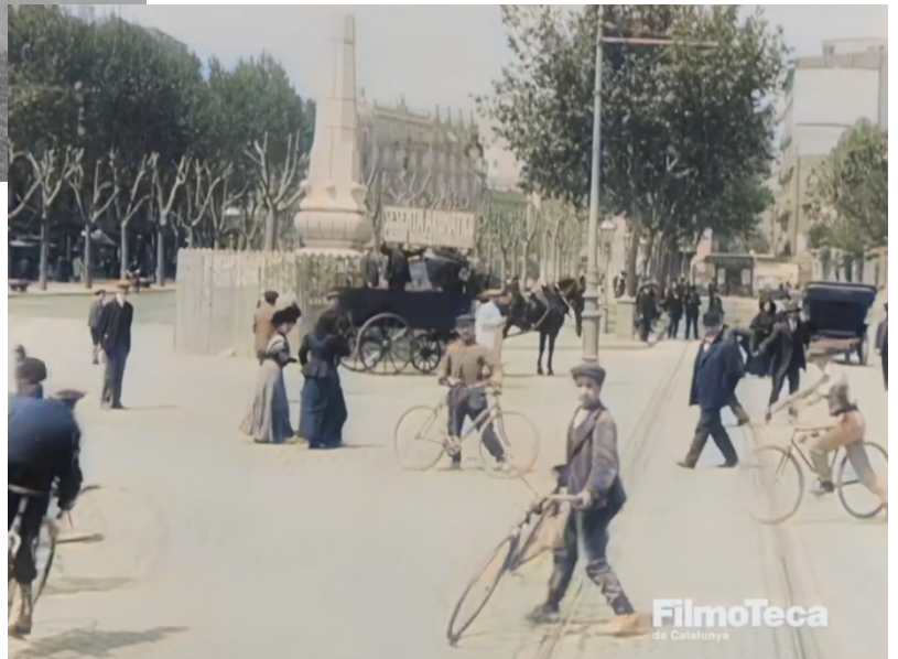
Filmació antiga del Passeig de Gràcia des del punt de vista d'un tramvia.