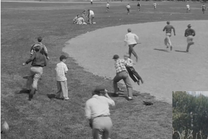
Ultimátum a la tierra, (1951)