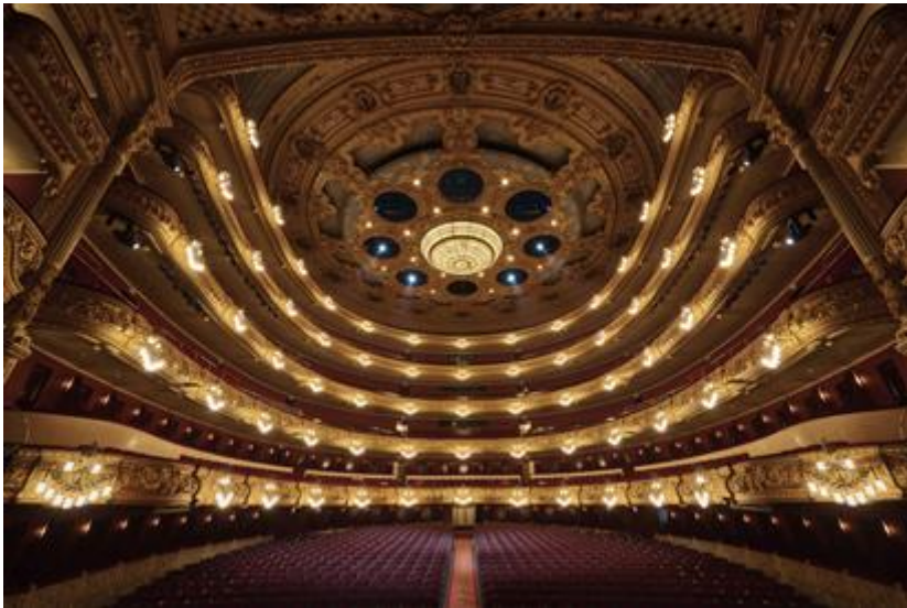
Fotografia de l'interior del Gran Teatre del Liceu.