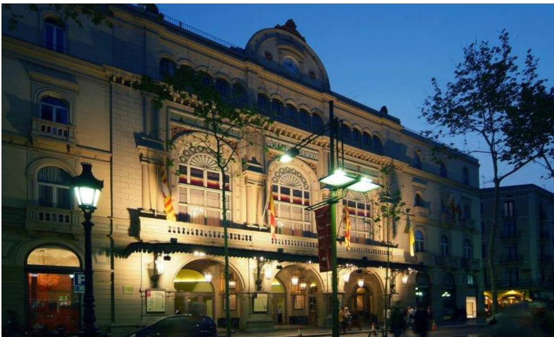
Fotografia de la façana del Gran Teatre del Liceu.