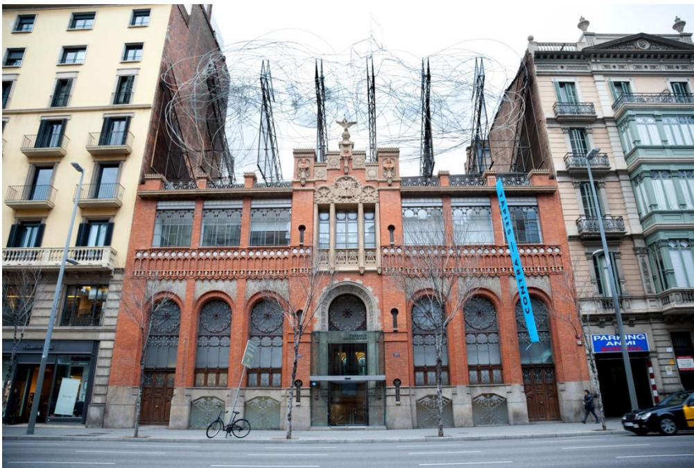
Fotografía de la fachada de la Fundació Tàpies