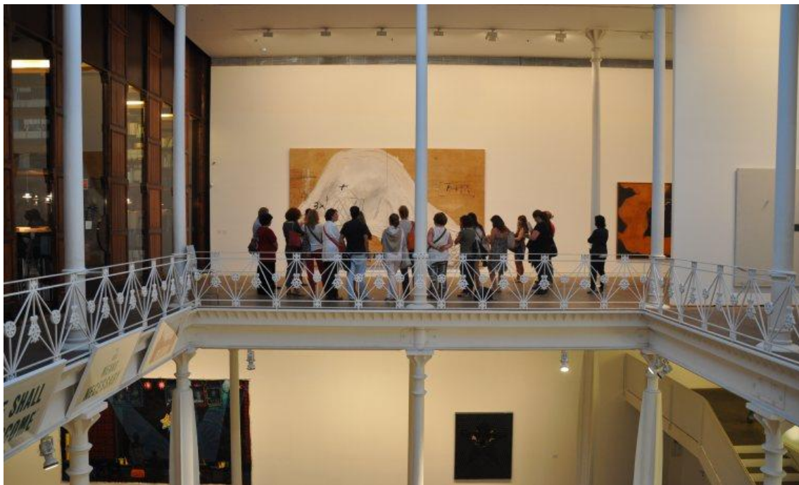
Fotografía de una de las salas de la Fundació Tàpies.