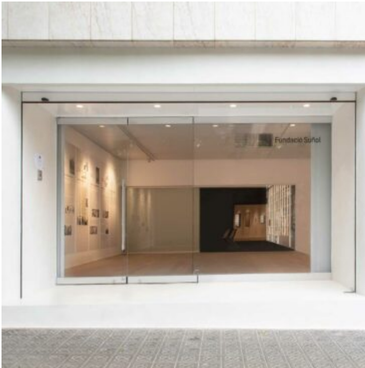
Fotografía de la fachada de la Fundación Suñol.