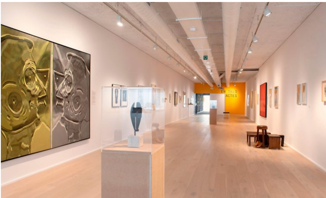
Fotografía del interior de la Fundación Suñol.