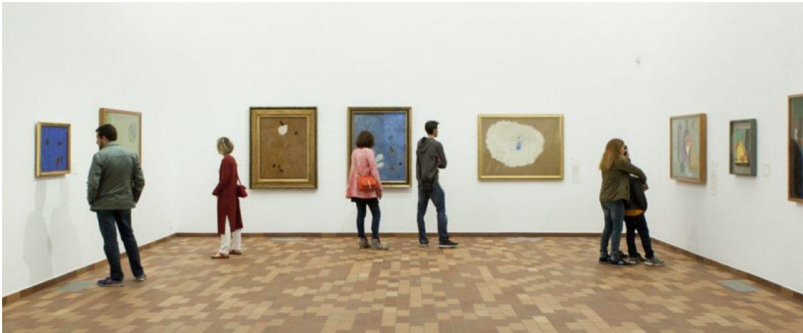
Fotografia d'una de les sales de la Fundació Miró.