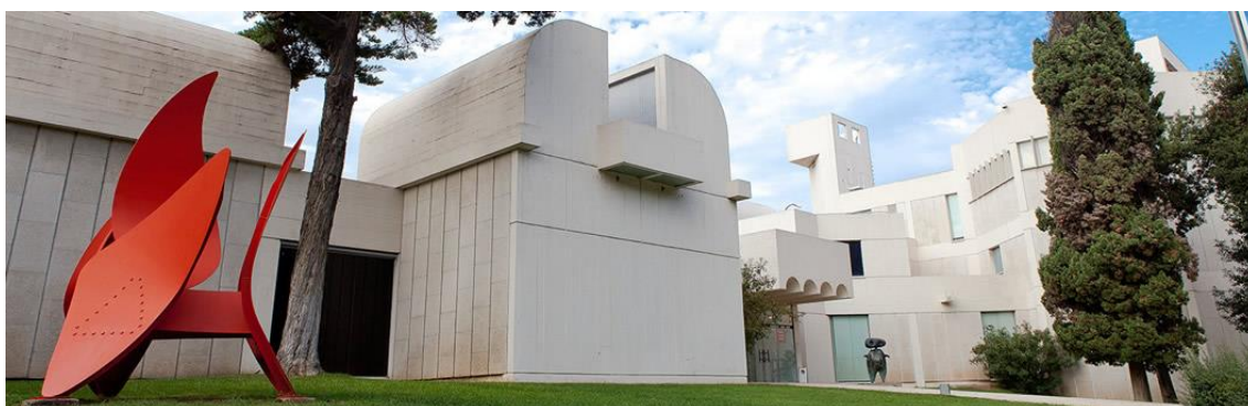
Fotografia de la façana de la Fundació Miró.