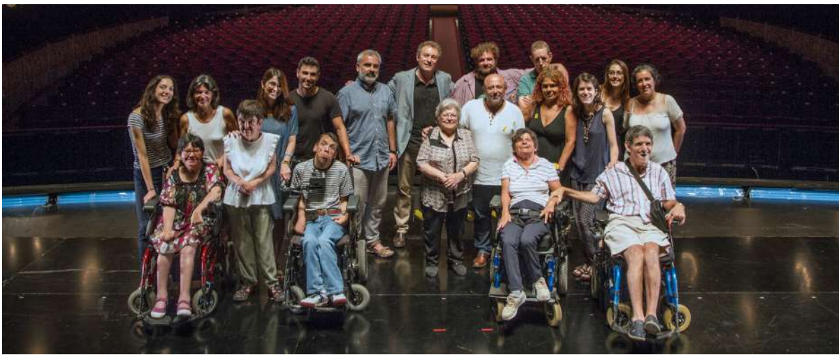
Tots i totes fem possible Apropa Cultura. Institucions, equipaments culturals, mecenes, professionals de l'àmbit social i educatiu, usuaris i usuàries de les entitats socials i l'equip del programa. Fotografia realitzada amb motiu del rodatge del vídeo de la campanya per a la Setmana Apropa Cultura 2018, una imatge que reconeix la importància de totes les persones implicades en el projecte.