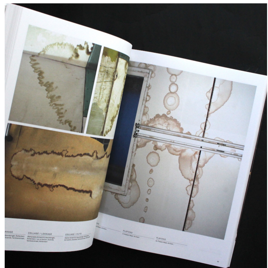
Foto dreta i esquerra. Projecte Living surfaces de l'artista Lizan Feijsen.