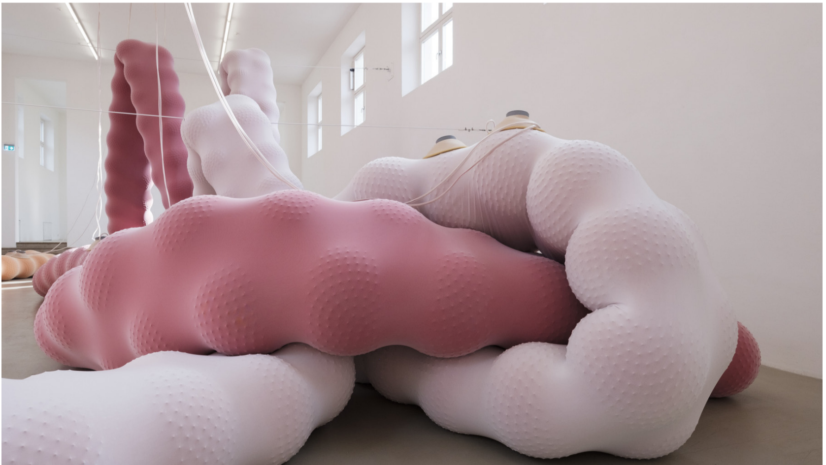
Foto dalt. "Two Blocks Chair" de l'estudi d'art digital Six N.Five i el dissenyador Artur de Menezes Foto baix. Obra de l'artista Eva Fàbregas