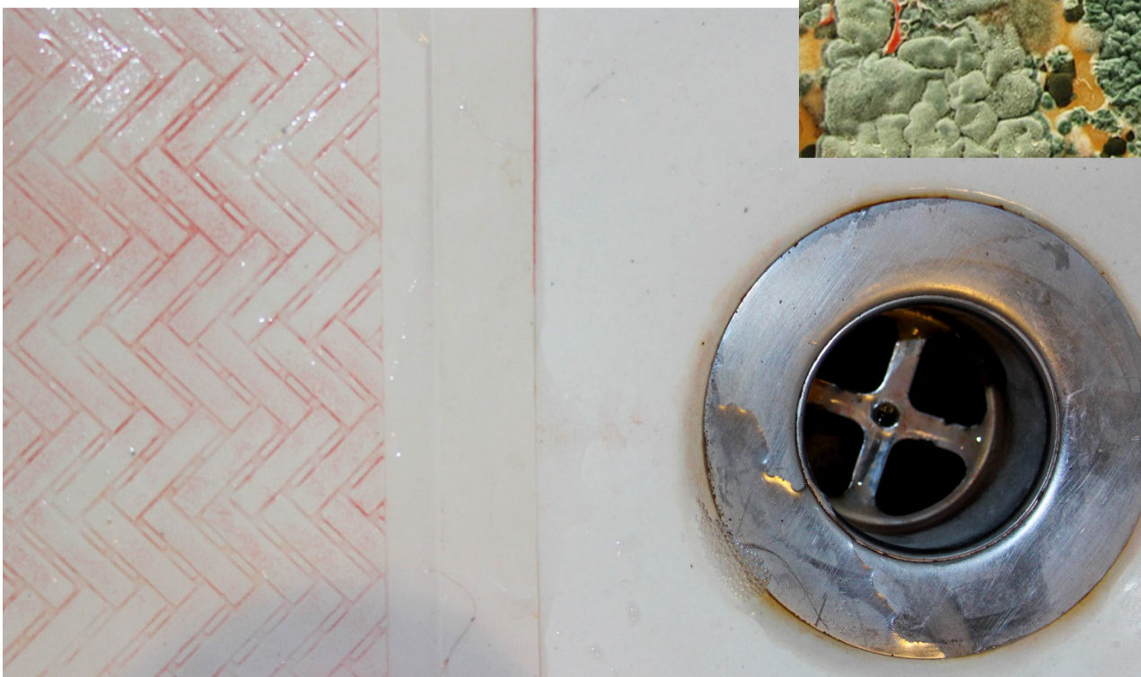
Foto dalt. Projecte "Sea Chair" de Studio Swine Foto baix. Pigment creat per bactèries i projecte "Contagion advertisemet" de Steven Soderburgh's Contagion