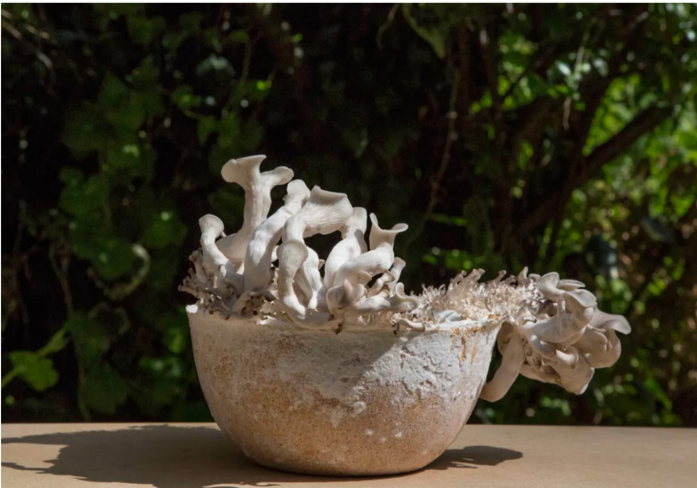
Foto dalt. Cultiu de cel·lulosa bacteriana de la dissenyadora Suzanne Lee Foto esquerra. "Growing Lab" de l'Officina Corpuscoli