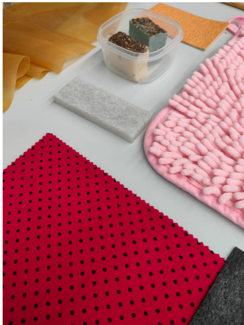
Foto dalt. Proposta compositiva d'una participant Foto baix. Materials proposats per descriure l'espai de treball