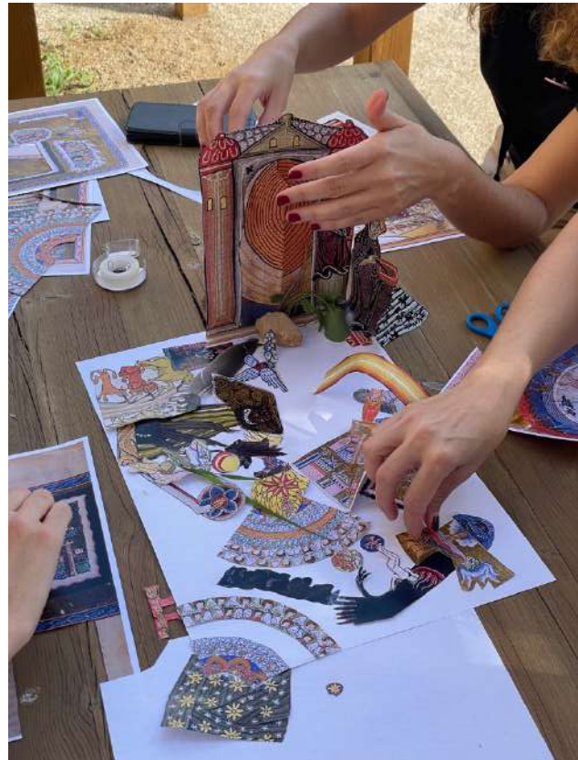
Collage de miniatures i secrets