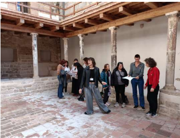
Interpretar una partitura d'altres

Pel que fa les audicions, la proposta començava observant els cantorals exposats al Dormidor i comentant els seus sistemes de notació. Allà també vam posar en valor la relació de la música d'Hildegard amb la lingua ignota – amb què pretenia recuperar el llenguatge perdut d'Adam, de la mateixa manera que la música pretèn recuperar el so perdut del paradís– per tal d'estimular la imaginació al voltant de formes alternatives de comunicació. En aquest cas, el subgrup es dividia en grups de 3 o 4 persones, que es repartien pel Monestir (en concret, pel Claustre, el Refetor i la Sala Capitolar) per a trobar o reconèixer sons en l'espai que poguéssin funcionar com a revelacions. A partir de les sonoritats descobertes, cadascun dels equips va generar una partitura a partir d'un llenguatge inventat, subvertint la idea que la composició musical ha de ser gaudida des de l'expertesa. Recuperant a Hildegard: “[C]ompuse cantos o melodías en alabanza a Dios y a los Santos sin enseñanza de ningún hombre, y los cantaba, sin haber estudiado nunca ni neumas ni canto”. Un cop acabat aquest exercici, van intercanviar-se les partitures i cada grup va musicar la peça d'un altre al Claustre dels gats, espai distès que havia servit com a safreig del Monestir.