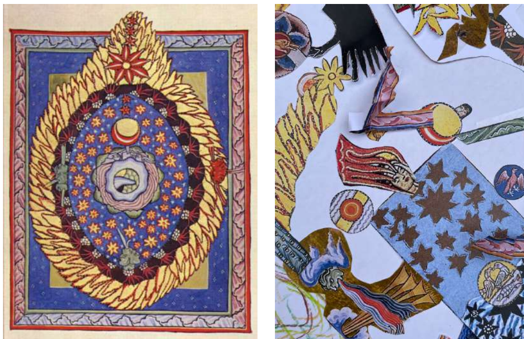
Miniatura d'Hildegard i collage de miniatures resultant a la sessió

temporalitats, on es troben sediments de tots els temps, on —com ens recordava la Gemma Bonet— “el passat es fa present”.