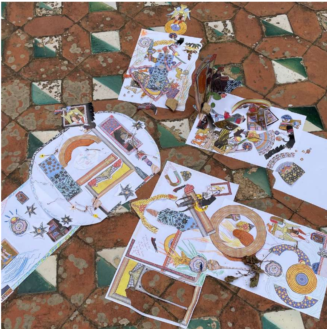
No estem soles

Reunides de nou al claustre, vam compartir sensacions i vam estendre a les assistents una invitació per a realitzar a casa: escriure una carta a Hildegarda i, en forma de ritual, deixar-la anar en un espai significatiu per a cadascuna d'elles.