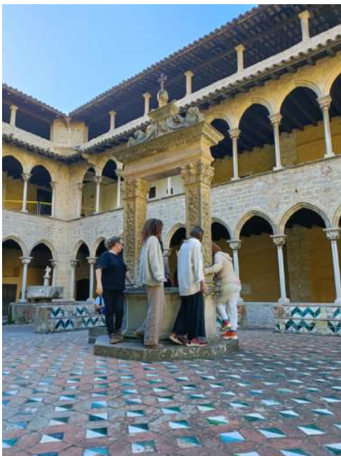
Dramatització col·lectiva d'una visió-collage