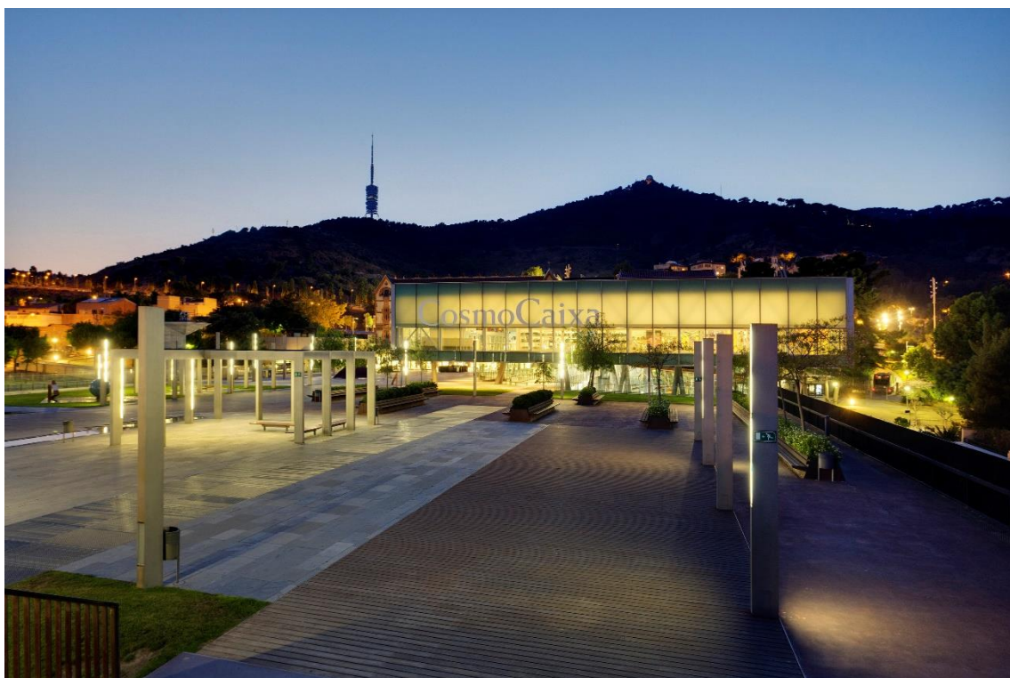
Fotografia de la façana del CosmoCaixa.