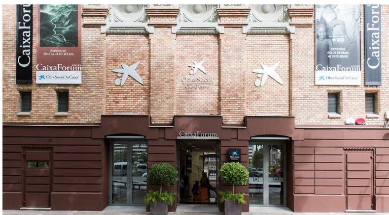
Fotografía de la fachada del CaixaForum Lleida.