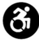
Accessibilitat motriu o física