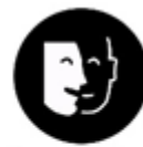
Accessibilitat intel·lectual o psíquica