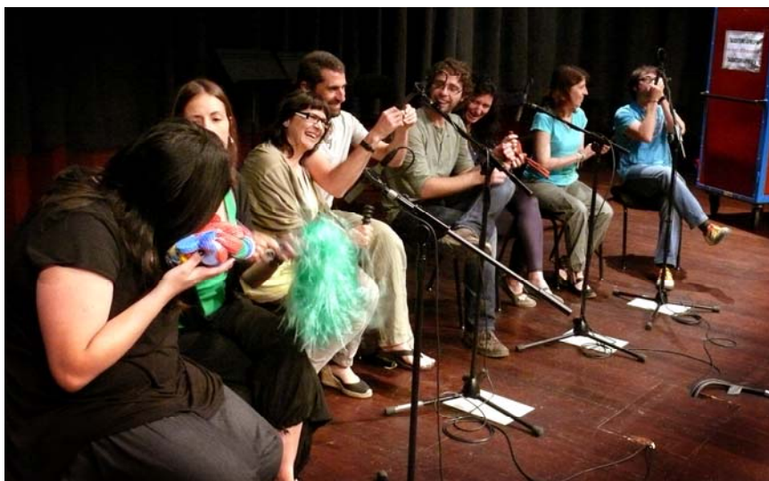
Assistents de la jornada de formació musical recreant el so d'una selva

http://www.youtube.com/watch?v=Dp7aJ6zoLXY