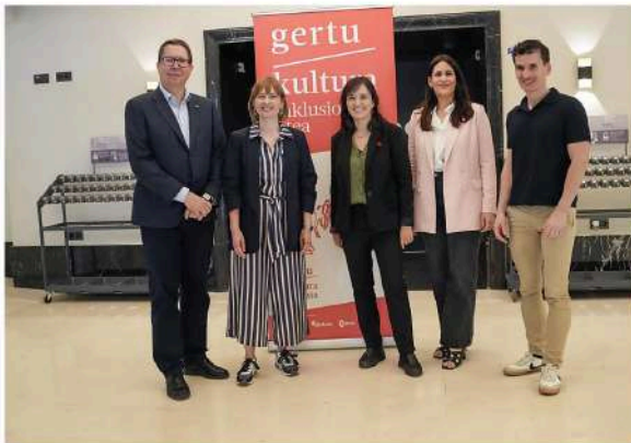
Presentación de Gertu Kultura, este lunes en la Sala BBK, Ayuntamiento de Bilbao

Nace Gertu Kultura, iniciativa público-privada para fomentar la inclusión y «eliminar barreras» sociales