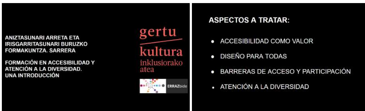
Online formakuntzan erabilitako diapositibak.

Errazbide programaren baitan, bi formakuntza burutu dira 2025ean. Lehena, “Irisgarritasun unibertsala eta aniztasunarekiko arreta kultura-inguruneetan. Sarrera bat” , maiatzaren 30ean egin zen online formatuan, Gertu Kulturaren eskutik, eta sareko bitartekari kulturei zuzenduta. 43 pertsona konektatu ziren.