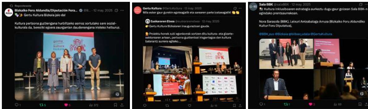
Irudiak sare sozialetan: Gertu Kultura Bizkaiaren inaugurazioa.

Instagramen denbora errealean zabaldu zen inaugurazio-ekitaldia. Nabarmentzekoa da, gainera, sare sozialetako hedapen horretan, programaren parte diren gizarte-erakundeek eta programatzaile kulturelek agertutako jarrera positiboa eta laguntzazkoa. Izan ere, Instagramen, adibidez, argitalpen hau urteko partekatuen artean izan da alde handiarekin.