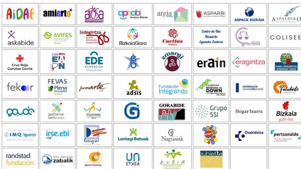
Gertu Kultura Bizkaia sare soziala.