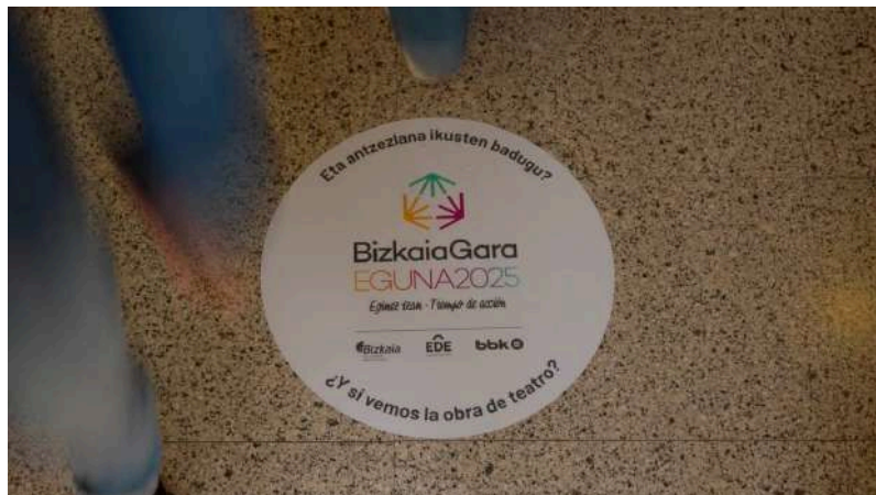
Irudia: BizkaiaGara Eguna 2025en logotipoa.

BizkaiaGara Eguna herritarrei dei egiteko ekimen bat izan zen, lankidetzak kolektiboaren bidez Bizkaiko lurraldea hobetzea helburu zuena, inguruko beharrei erantzunez. Egun horretan, boluntarioek eta nahi ez den bakardadean dauden pertsonak antzerki, zinema edo musikako emanaldi batez gozatu zuten elkarrekin. Gainera, BizkaiaGara Egunaren 2025eko bideoan eta haren webgunean parte hartu genuen.