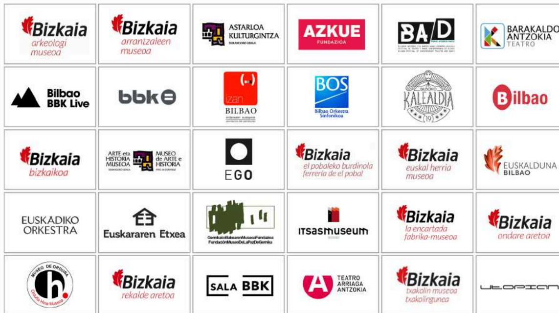
Red cultural Gertu Kultura Bizkaia.