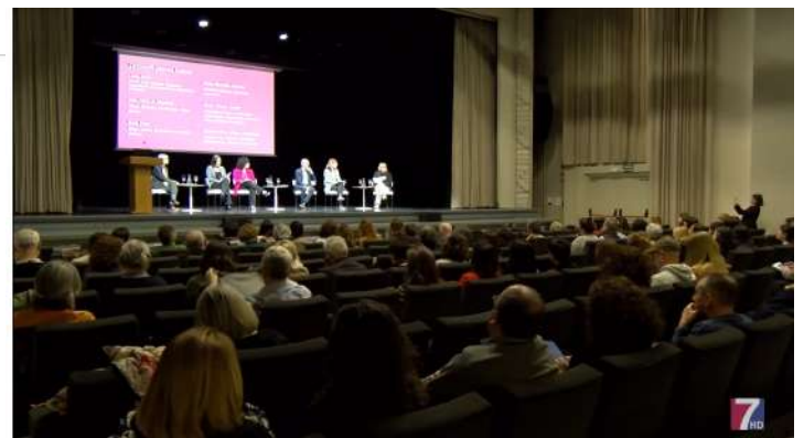
Imágenes de la inauguración de Gertu Kultura Bizkaia en los medios de comunicación.