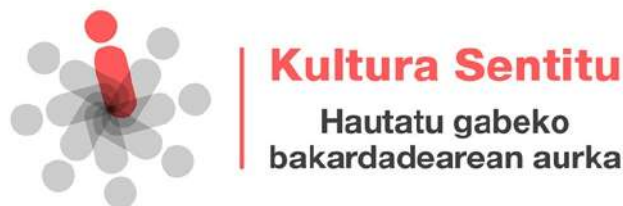
Imagen del logotipo de la campaña contra la soledad no deseada.

Cuando abrir las puertas del museo no es suficiente y para disfrutar de la cultura podemos activar otras formas de relación.