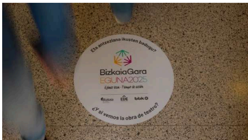
Imagen del logotipo del BizkaiaGara Eguna 2025.

BizkaiaGara Eguna fue una iniciativa de llamamiento a la ciudadanía que tiene por objetivo mejorar el territorio de Bizkaia a través de la colaboración colectiva, dando respuesta a las necesidades del entorno. Consistió en una jornada en la que personas voluntarias y personas en situación de soledad no deseada, disfrutaron juntas de una velada de teatro, cine o música. Además, participamos en el video de BizkaiaGara Eguna 2025 así como en su página web .