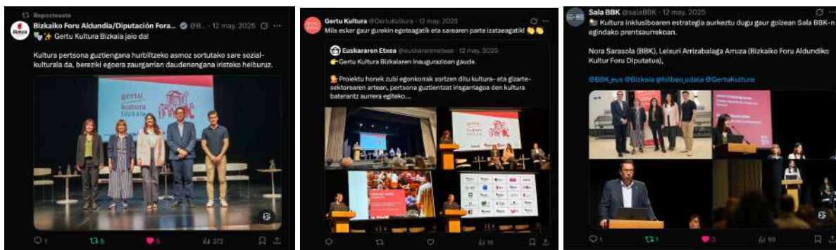
Imágenes de la inauguración de Gertu Kultura Bizkaia en redes sociales.

Redes sociales: Durante la inauguración se compartió en las redes sociales de Gertu Kultura (X, Instagram y Facebook) fotografías del evento con menciones a las diferentes entidades e instituciones participantes. Además, se interactuó con aquellas personas que, por su parte, fueron difundiendo su participación en la jornada generando interacción con las mismas y mostrando Gertu Kultura como un programa cercano también en el ámbito digital. Además, se realizó un vídeo resumen de la jornada y se difundió un post con las diferentes personas participantes en el evento.