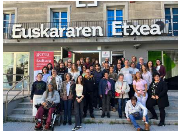
Imágenes del primer encuentro en Euskararen Etxea.

La asistencia al taller fue de 48 personas del ámbito social y cultural: