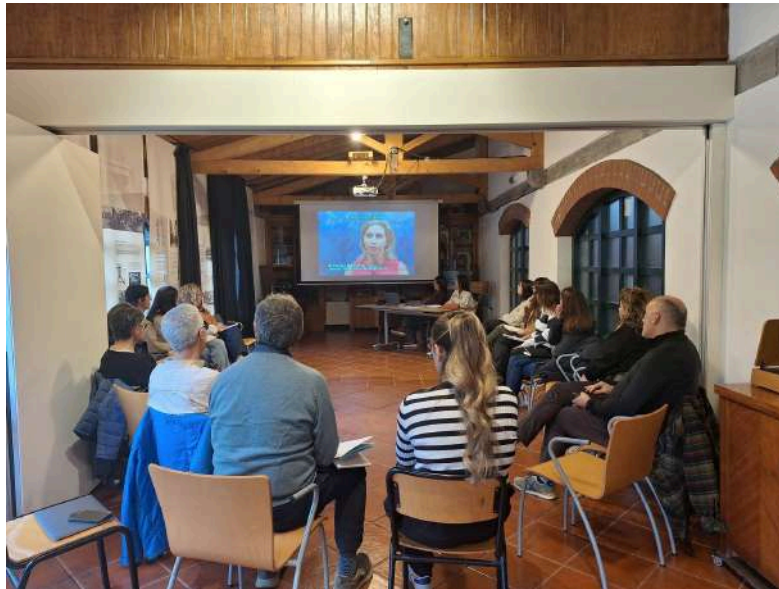
Imagen de la primera sesión del programa Museos y Alzheimer.

Museos participantes en la edición 2025-2026: Txakolin Museoa - Txakolingunea, Museo de Bellas Artes de Bilbao, Orduña Hiria Museoa, Euskararen Etxea, Museo de la Paz de Gernika, Arrantzaleen Museoa.