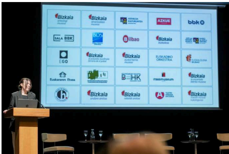
Imagen de la presentación del programa y difusión de la red cultural y social.