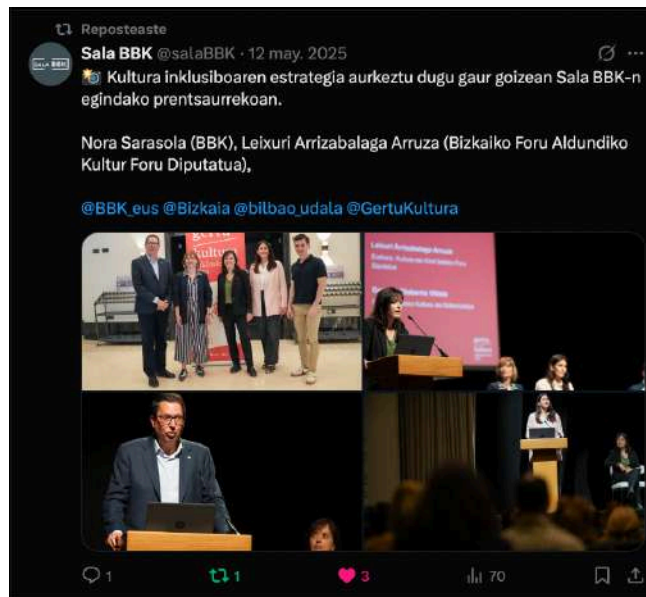
Imágenes de la inauguración de Gertu Kultura Bizkaia en redes sociales.