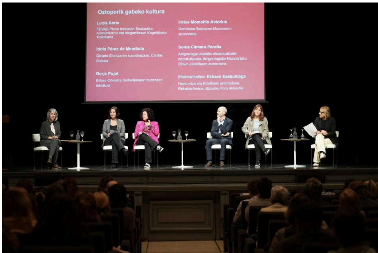
Imagen de la mesa redonda “Cultura sin barreras”.