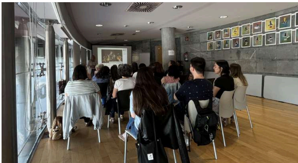
Imagen de la formación Errazbide en colaboración con FEVAS Plena Inclusión Euskadi.

La segunda formación titulada “La accesibilidad cognitiva como herramienta para la inclusión” , se realizó el 17 de junio de forma presencial en colaboración con FEVAS Plena Inclusión Euskadi , en Itsasmuseum de Bilbao. Estuvo destinada a profesionales de la cultura para conocer mejor las barreras de las personas con discapacidad intelectual o del desarrollo en el acceso a la cultura, así como la importancia de la accesibilidad cognitiva.