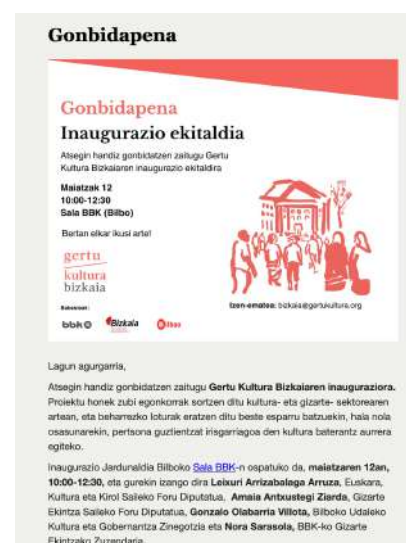
Imagen de la invitación de la inauguración a través de Mailchimp.