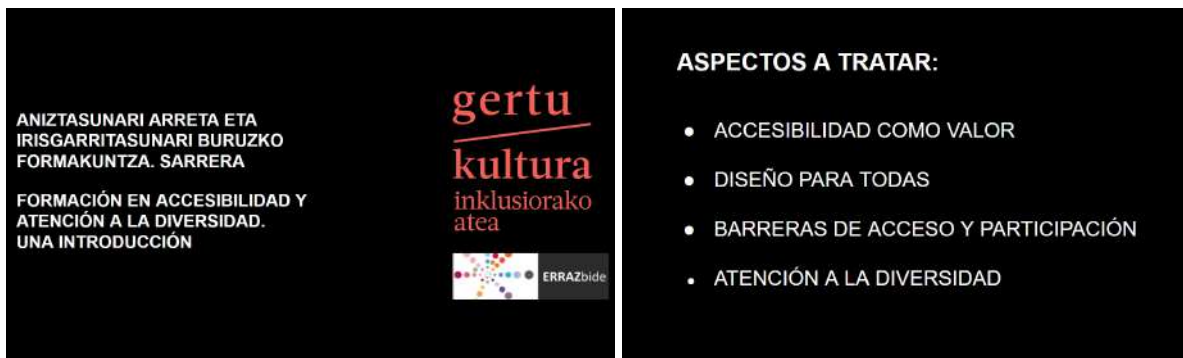
Diapositivas utilizadas durante la formación online.

En el marco del programa Errazbide, se han llevado a cabo dos formaciones durante 2025. La primera formación titulada “Introducción a la Accesibilidad universal y atención a la diversidad en entornos culturales” , se realizó el 30 de mayo en formato online de la mano de Gertu Kultura, y estuvo dirigida a mediadores/as culturales de la red. Se conectaron 43 personas.