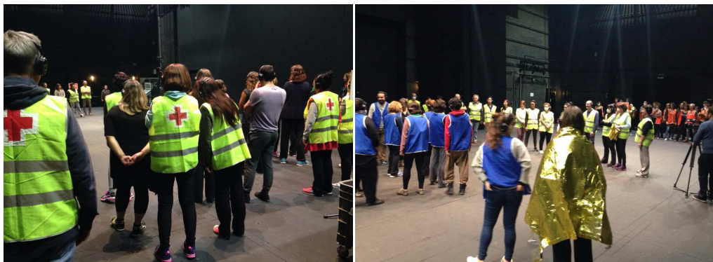
El públic com a dispositiu de l'espectacle