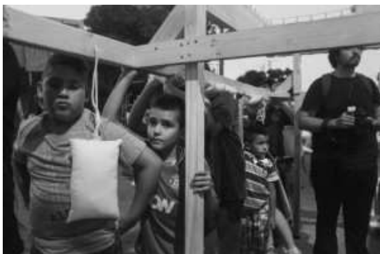
Niños de La Caleta a punto de levantar La Moneda en La Legua